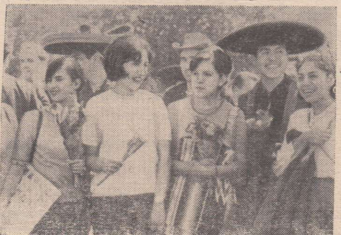
Посланцы молодежи стран Латинской Америки.