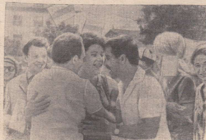
Еще одна встреча давних друзей.