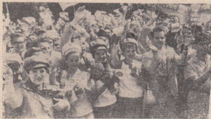
Советская делегация в столице фестиваля.